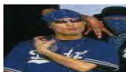
Синяя футболка команды Dodgers и косынка (bandana) символизируют банду Crips.