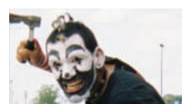
К признакам Juggalo относится клоунское лицо и топорик.

Эта уличная банда возникла в Калифорнии, она связана с тюремной бандой "Mexican Mafia – мексиканская мафия". Их соперники - Norteños. Признаки: